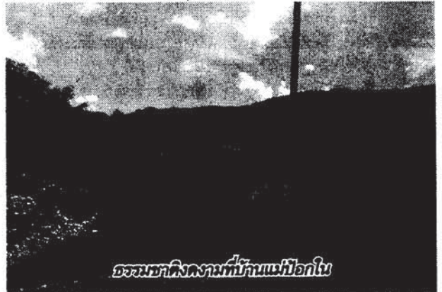
ธรรมชาติงดงามที่บ้านแม่มือกใน

พ่อหมอเล่าว่า ทุกวันนี้พยายามถ่ายทอดความรู้แพทย์แผนไทยให้ลูกสาว และให้เด็กเยาวชนรุ่นหลังในหมู่บ้าน ไม่เคยคิดหวัง เพราะไม่อยากให้ความรู้สูญหายไป และดีใจมากที่ทางมูลนิธิเตชะทาคุ มาช่วย