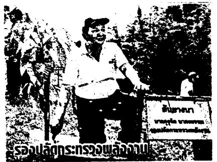
รองปลัดกระทรวงป่าไม้

ปลูกป่าในครั้งนี้เป็นพื้นที่ที่ราษฎรเคยใช้ประโยชน์ในรูปแบบไร่หมุนเวียนมาก่อน คือพื้นที่ป่าที่ถูกแผ้วถางเพื่อทำไร่ปลูกข้าว แบบหมุนเวียนเป็นวงรอบ 7 ปี คือเมื่อปีที่ 1 ปลูกและเก็บเกี่ยวแล้วก็ขยายแผ้วถางพื้นที่แห่งใหม่ เก็บเกี่ยวแล้วก็ย้ายไปอีก จนครบ 7 ปี ก็จะหันกลับมาปลูกพื้นที่เดิมเมื่อ 7 ปีที่แล้วอีกครั้งหนึ่ง จึงทำให้พื้นที่ถูกบุกกรุกทำลายเป็น