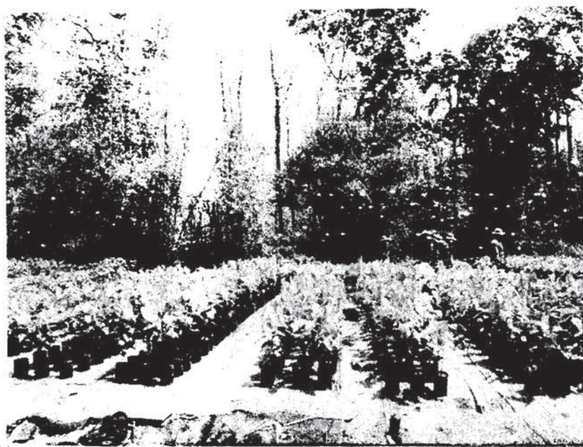
คุณเกษตร/รายงาน

นอกจากจะเป็นไม้มงคลทางพุทธศาสนาแล้ว ต้นสาละอินเดียนั้นยังมีสรรพคุณด้านสมุนไพร โดยพบว่ายางสามารถใช้เป็นยาสมานแผล ยาห้ามเลือด ใช้แก้โรคผิวหนัง ตุ่มพุพอง โรคซิฟิลิส โภโณเรีย วัณโรค โรคท้องร่วง บิด โรคหูด กลาก เป็นต้น ผลใช้แก้โรคท้องเสีย ท้องร่วง ได้อีกด้วย