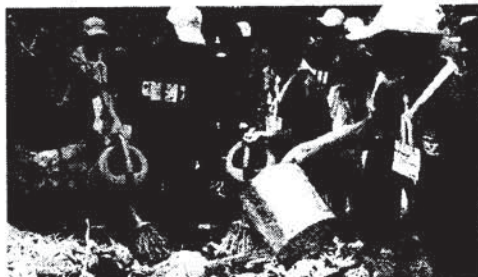
เยาวชนค่ายกล้าเยี่ยมเรียนรู้วิถีการทำปุ๋ยหมักชีวภาพแบบไม่พลิกกอง

ล่าสุด บริษัทผลิตไฟฟ้าราชบุรีโฮลดิ้ง จำกัด (มหาชน) ร่วมกับกรมป่าไม้ จัดกิจกรรมค่ายเยาวชนกล้าเยี่ยมภาคเหนือ โครงการ “คนรักป่า ป่ารักชุมชน” คัดเลือกตัวแทนจาก 10 จังหวัดภาคเหนือ คือ น่าน แพร่ ตาก สุโขทัย อุตรดิตถ์ ลำปาง ลำพูน เชียงใหม่ พะเยา และเชียงราย อายุ 13-15 ปี จำนวน 80 คน เข้าร่วมโครงการเรียนรู้เกี่ยวกับป่าชุมชนและธรรมชาติ ที่ชุมชนบ้านหนองผุก ผ่านกิจกรรมต่างๆ ที่จัดขึ้น เช่น เรียนรู้วิถีชีวิตการอยู่กับป่าอย่างยั่งยืนของชุมชน เรียนรู้วิถีโลกร้อน เยาวชนกล้าเยี่ยม สร้างสวนสมุนไพร และอนาคตของป่าชุมชน