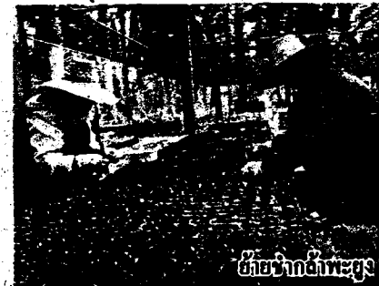
วิจัยจากไม้พะยุง