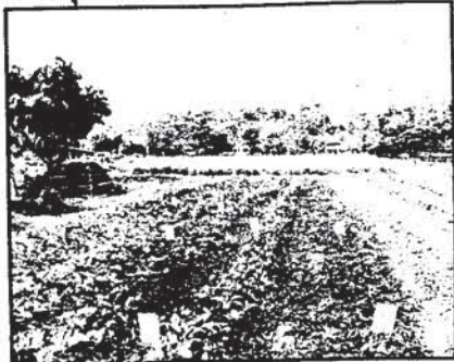
น่าน ที่อยู่ในโครงการปิดทองหลังพระ เป็น

ซึ่งล่าสุด นายนิวัฒน์ธำรง บุญทรงไพศาล รองนายกฯ และ รว.พาดิษฐ์ ม.ร.ว. ดิศนัดดา ดิศกุล เลขาธิการมูลนิธิแม่ฟ้าหลวง พร้อมคณะ นายชุมพร แสงมณี ผู้ว่าราชการจังหวัดน่าน และหัวหน้าส่วนราชการ ได้ลงพื้นที่ติดตามความคืบหน้าในโครงการฯ ที่บ้านน้ำปึก ค.ศาลชุม อ.น้ำปาด จ.น่าน ซึ่งเป็นพื้นที่ต้นน้ำ