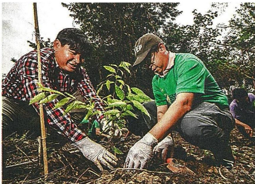
ช่วยกันปลูกป่า

แต่ละวันมี นักท่องเที่ยวทั้งไทย และชาวต่างชาติ แวะเวียนมาปั่นจักรยาน พายเรือคายัค และเดินเล่น เพื่อตีมน้ำบรรยากาศ อันบริสุทธิ์