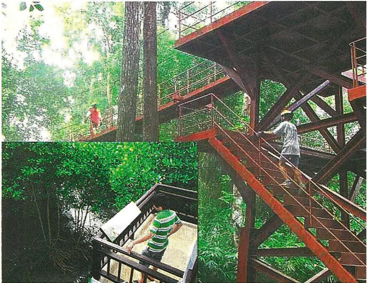
ปรับปรุงเส้นทางศึกษาธรรมชาติ

วิ ถีชีวิตคนเมืองที่ต้องเร่งรีบ ดิ้นเข้าทำงานหนัก เจอปัญหาเร่ร่อนมลภาวะ เป็นพิษ สุขภาพเสื่อมโทรม ล้วนเป็นปัจจัยเสี่ยงที่ส่งผลร้ายต่อสุขภาพ การมีสถานที่พักผ่อน พักใจ ชาร์จพลังงานให้ชีวิตถือเป็น สิ่งสำคัญเพื่อเตรียมพร้อมดำเนินชีวิตในวันใหม่ฯ