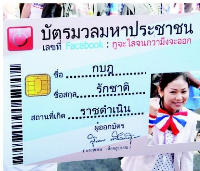
บัตรประชาชนมวมมหาประชาชน