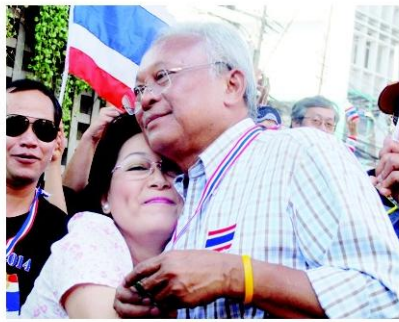
ขวัญใจแม่ยกถึงกับเข้าไปกอด