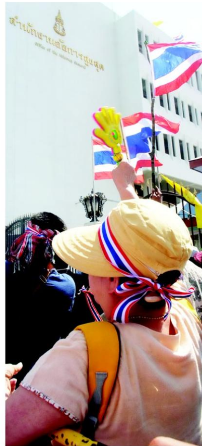
ล้อมสำนักงานอัยการสูงสุด