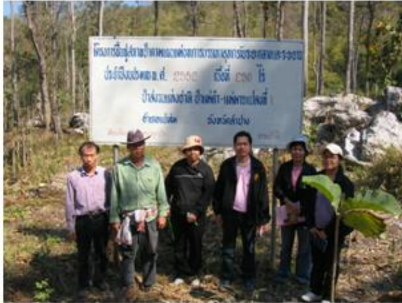
หัวหน้าโครงการฯ นำคณะติดตามเข้าพื้นที่แปลงปลูกป่าของโครงการ

1) โครงการฟื้นฟูสภาพป่าตามแผนแม่บทการบรรเทาอุทกภัยระยะกลาง และระยะยาว ประจำปีงบประมาณ พ.ศ. 2552 ป่าสงวนแห่งชาติป่าแม่ตา-แม่มาย แปลงที่ 1