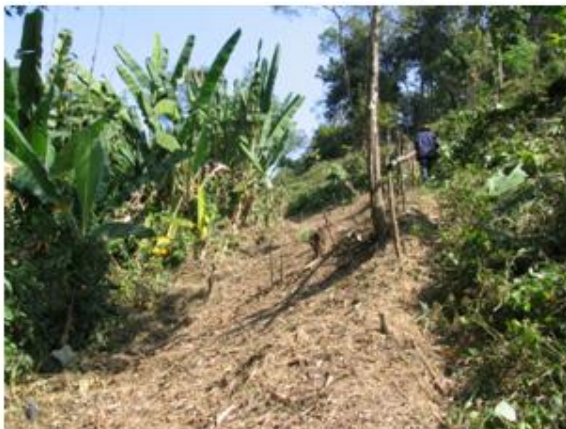
แนวกันไฟ