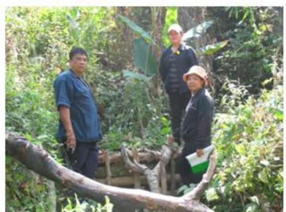
ฝายต้นน้ำแบบผสมผสาน