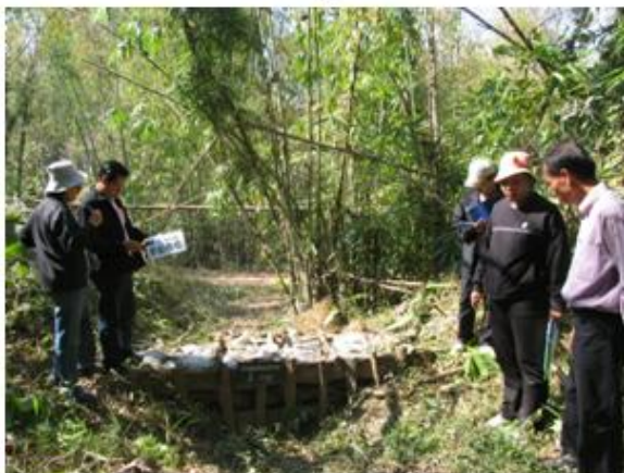
ฝายต้นน้ำแบบผสมผสาน