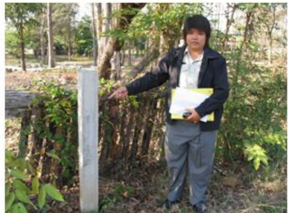
หลักแสดงแนวเขตป่าสงวนแห่งชาติ