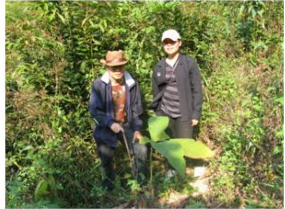
หัวหน้าโครงการฯ นำคณะติดตามเข้าพื้นที่แปลงปลูกป่าของโครงการ