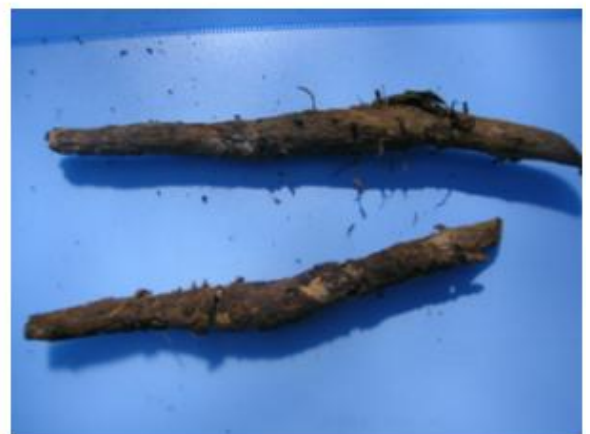
กล้าไม้ที่นำไปปลูกมีปลวกเข้ากัดกินเสียหายเป็นจำนวนมาก