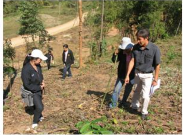
หัวหน้าโครงการฯ นำคณะติดตามเข้าพื้นที่แปลงปลูกป่าของโครงการ