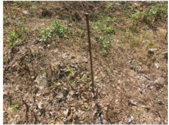
แปลงปลูกป่าบริเวณที่มีน้ำขังทำให้กล้าไม้เสียหาย