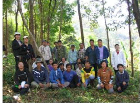
หัวหน้าโครงการฯ นำคณะติดตามเข้าพื้นที่แปลงปลูกป่าของโครงการ