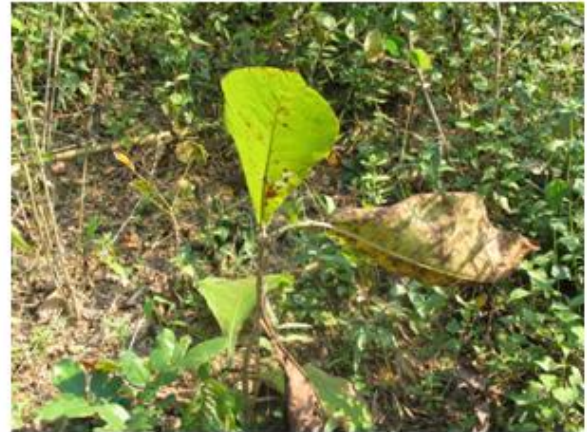
บริเวณพื้นที่แปลงปลูกป่าของโครงการฯ มีวัชพืชปกคลุม