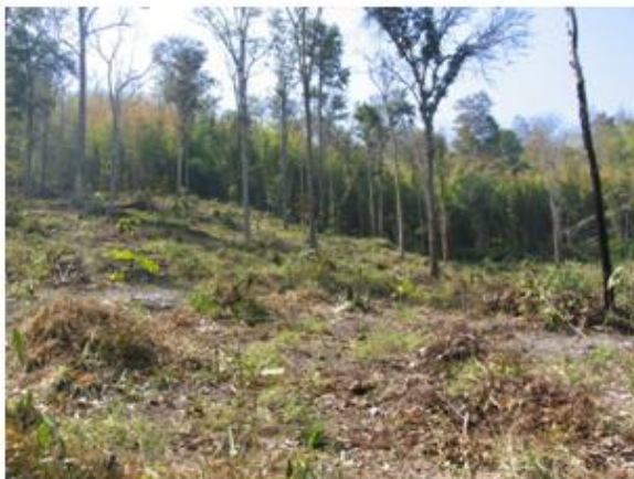
บริเวณพื้นที่แปลงปลูกป่าของโครงการฯ