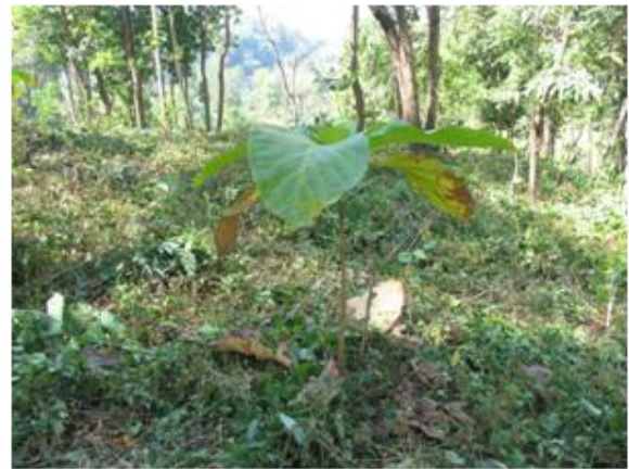
กล้าสักที่ปลูกในพื้นที่ของโครงการเจริญเติบโตดี