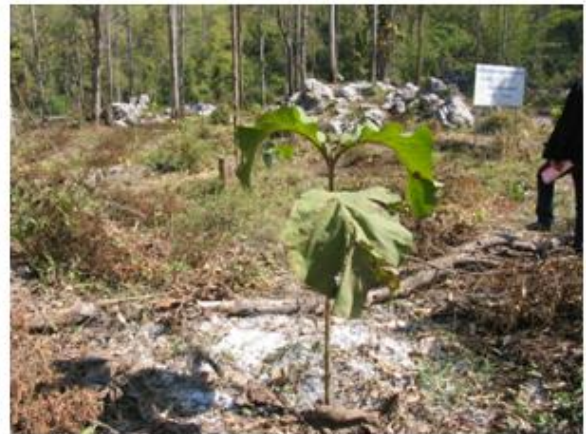
กล้าสักที่ปลูกมีการเจริญเติบโตดี