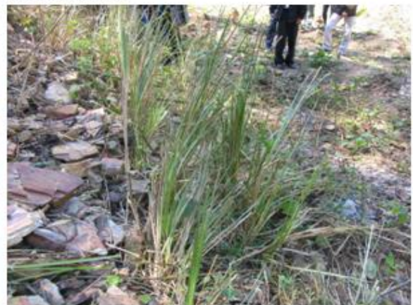
กล้าแฝกที่ปลูกในพื้นที่ของโครงการฯ บริเวณพื้นที่ลาดชัน