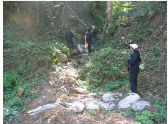
ฝายต้นน้ำแบบผสมผสานมีสภาพชำรุดเนื่องจากถูกน้ำป่าไหลหลาก