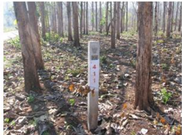
หลักแสดงแนวเขตป่าสงวนแห่งชาติ