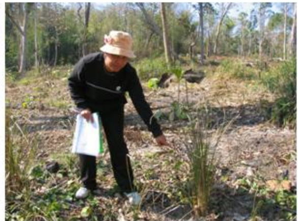
กล้าแฝกที่ปลูกในพื้นที่ของโครงการฯ