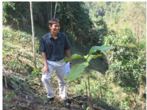
บริเวณพื้นที่แปลงปลูกป่าของโครงการฯ