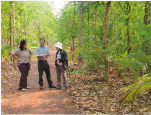
หัวหน้าโครงการฯ นำคณะติดตามงาน เข้าพื้นที่ปฏิบัติงาน