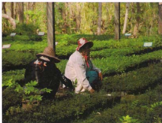
กล้าไม้สำหรับเตรียมการปลูกในกิจกรรมจัดทำแปลงสาธิตระบบวนเกษตร และปลูกซ่อมกิจกรรมบำรุงแปลงสาธิตระบบวนเกษตร ปีที่ 2-6