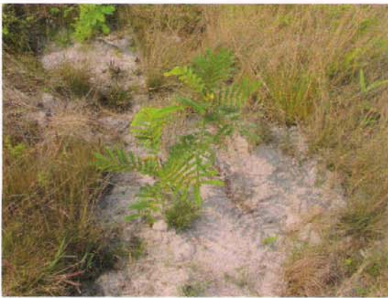
ต้นไม้ที่ปลูกในโครงการอายุ 2-6 ปี