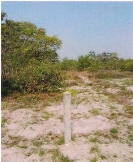
หลักเขตของโครงการฯ