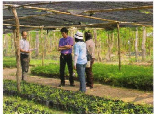
แปลงเพาะชำกล้าห้วยสำหรับแจกจ่ายราษฎร