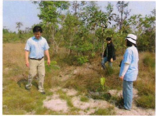
หัวหน้าโครงการฯ นำคณะติดตามงานเข้าพื้นที่ปฏิบัติงาน