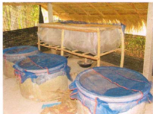
โรงทดลองเลี้ยงจิ้งหรีดเป็นตัวอย่างให้แก่ราษฎรในพื้นที่ได้เรียนรู้ เพื่อนำไปประกอบอาชีพเสริม