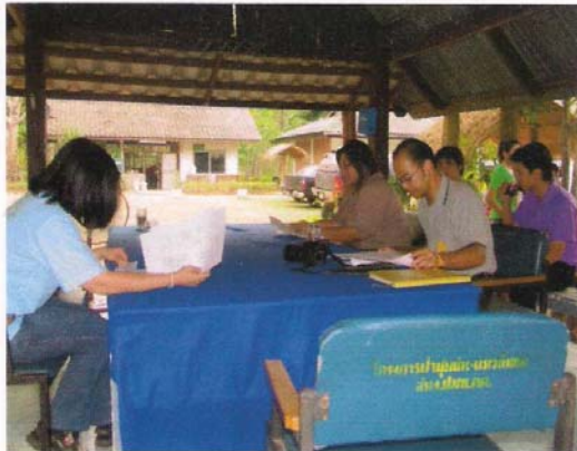
เจ้าหน้าที่บรรยายสรุปแผนการปฏิบัติงาน