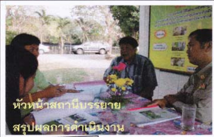
หัวหน้าสถานีบรรยาย สรุปผลการดำเนินงาน