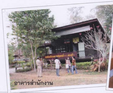
อาคารสำนักงาน