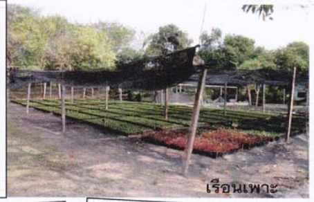
เรือนเพาะ