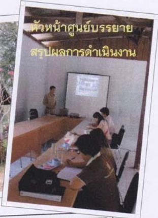
หัวหน้าศูนย์บรรยายสรุปผลการดำเนินงาน