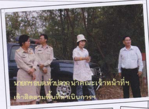
นายก อบต.หัวปลวก นำคณะเจ้าหน้าที่ฯ เข้าติดตามพื้นที่ดำเนินการฯ