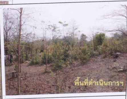
พื้นที่ดำเนินการฯ