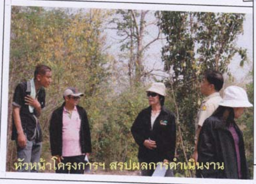
หัวหน้าโครงการฯ สรพผลการดำเนินงาน