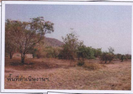
พื้นที่ดำเนินงานฯ