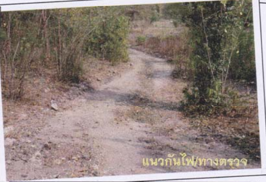
แนวกันไฟ/ทางตรวจ