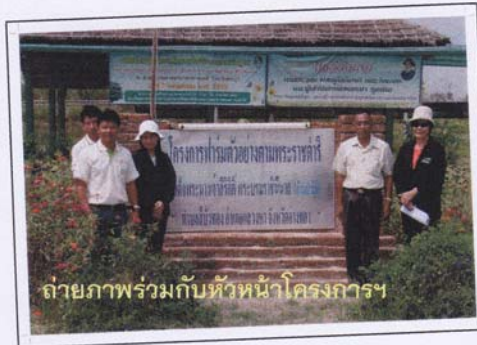
ถ่ายภาพร่วมกับหัวหน้าโครงการฯ

- โครงการฟาร์มตัวอย่างตามพระราชดำริ สมเด็จพระนางเจ้าสิริกิติ์ พระบรมราชินีนาถ จังหวัดอ่างทอง