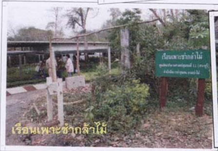
เรือนเพาะชำกล้าไม้