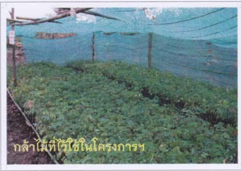
กล้าไม้ที่ใช้ใช้ในโครงการฯ