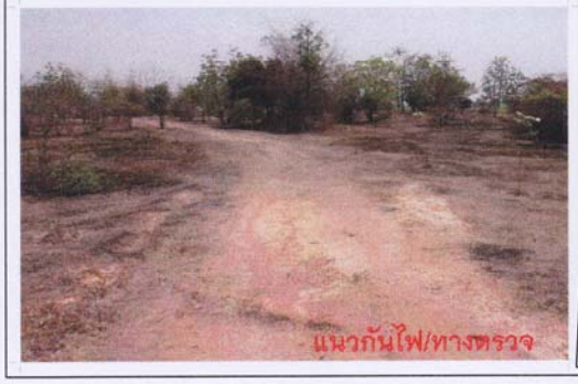
แนวกันไฟ/ทางตรวจ