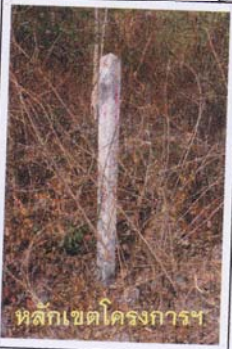
หลักเขตโครงการฯ