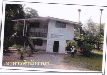
อาคารสำนักงานฯ