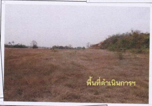
พื้นที่ดำเนินการฯ