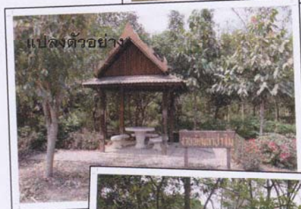
แปลงตัวอย่าง