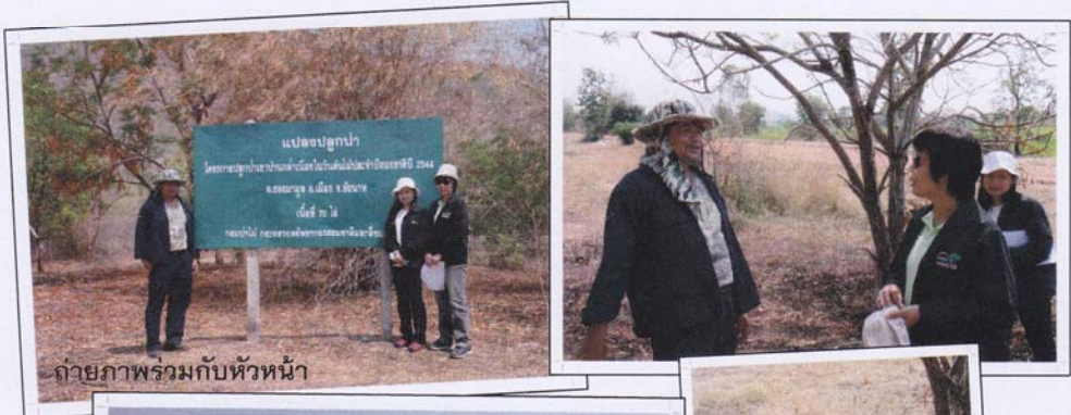
ถ่ายภาพพร้อมกับหัวหน้า