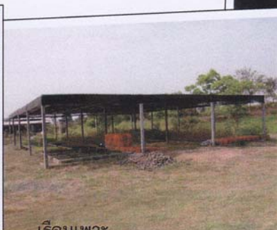
เรือนเพาะ