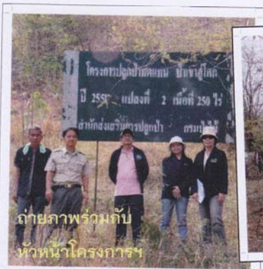
ถ่ายภาพพร้อมกับหัวหน้าโครงการฯ