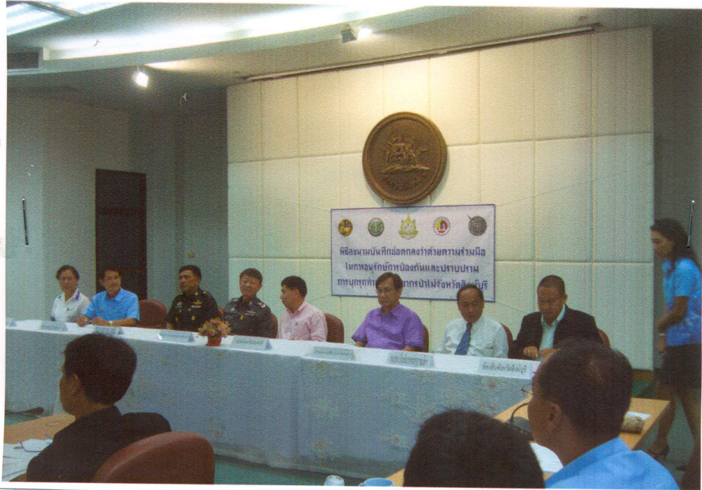
๘ หน่วยงาน ได้ลงนามบันทึกข้อตกลงว่าด้วยความร่วมมือในการอนุรักษ์ การป้องกันและปราบปรามการบุกรุกทำลายทรัพยากรป่าไม้จังหวัดสิงห์บุรี