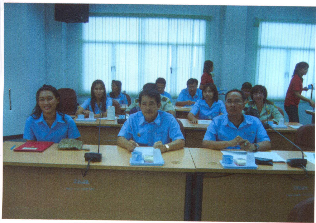
เจ้าหน้าที่ศูนย์ประสานงานป่าไม้สิงห์บุรี และเจ้าหน้าที่สำนักงานทรัพยากรธรรมชาติและสิ่งแวดล้อมจังหวัดสิงห์บุรี เข้าร่วมประชุมการแถลงข่าวจังหวัดสิงห์บุรี