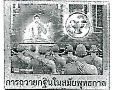
การถวายกฐินในสมัยพุทธกาล

ด้วย “ศาลปกครอง” ได้รับพระมหากรุณาธิคุณโปรดเกล้าฯ พระราชทานผ้าพระกฐินให้นำไปถวายพระสงฆ์จำพรรษา ณ พระอารามหลวงต่าง ๆ เป็นประจำทุกปี ซึ่งพิธีถวายผ้าพระกฐินพระราชทานนี้ จัดเป็นประเพณีบุญและพิธีที่สำคัญทางพระพุทธศาสนา โดยถวายผ้าพระกฐินฯ แต่พระสงฆ์ที่จำพรรษา ณ วัดนั้น ๆ ได้ปีละครั้ง ในการร่วมบำเพ็ญบุญและร่วมอนุโมทนา “กฐิน” นับว่าเป็นบุญมหากุศลเป็นอันมาก ซึ่งพุทธศาสนิกชนทั้งหลายได้ปฏิบัติสืบต่อกันมา